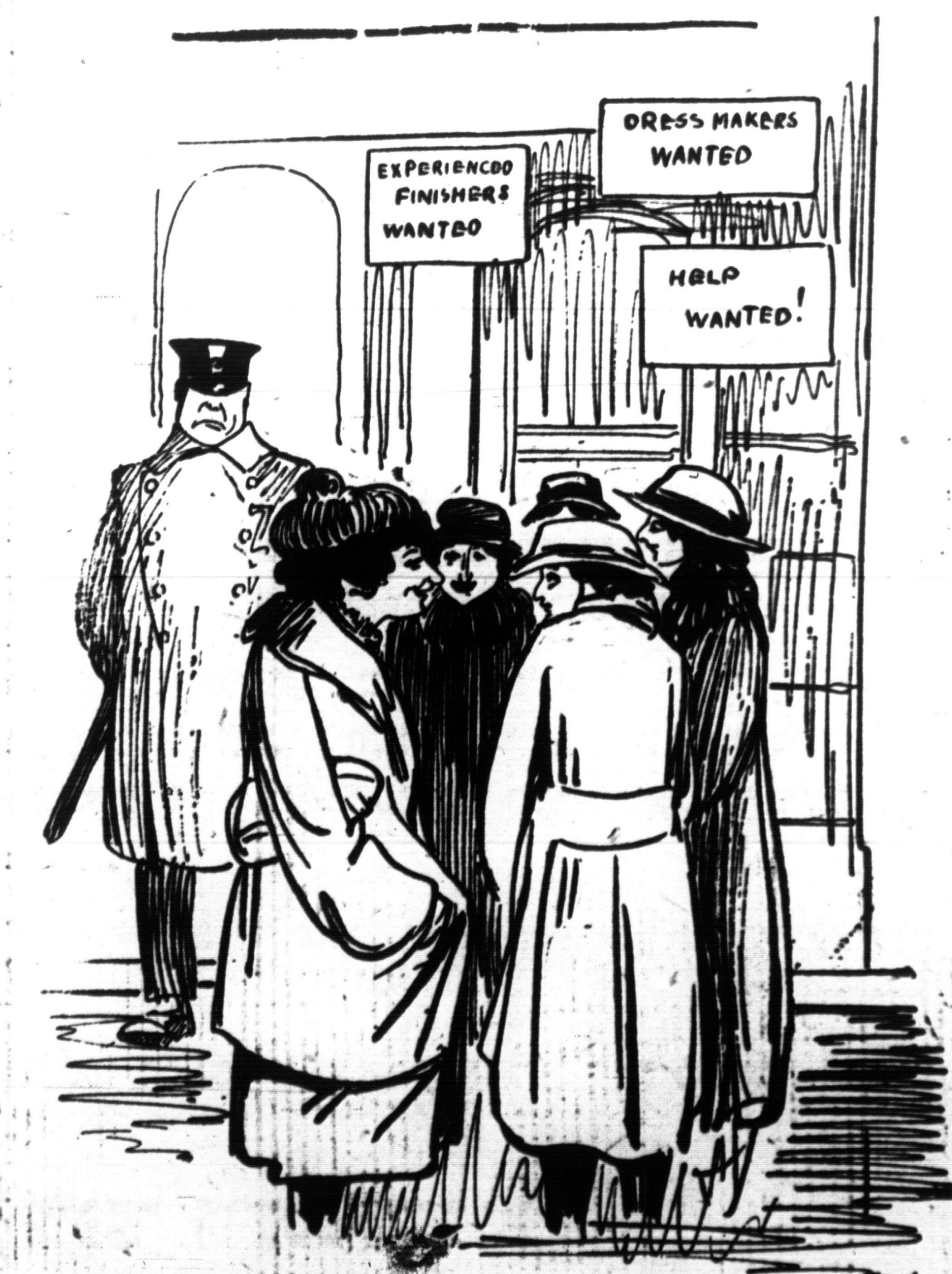
ער פארשמעתם נים, וואס זיי ריידען. און ער קומם צום שלום, אז נים שנדערש, נוי דשם מוזען זיין די ריכמיגע בשלשעוויקעם. 1 IN COUNTY